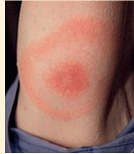
Erythème migrant chronique d'après Dan Lipsker CHU Strasbourg-Hôpital Civil Dermatologie.

Si la morsure a lieu au travail, il faut extraire sans délai la tique entière. Le