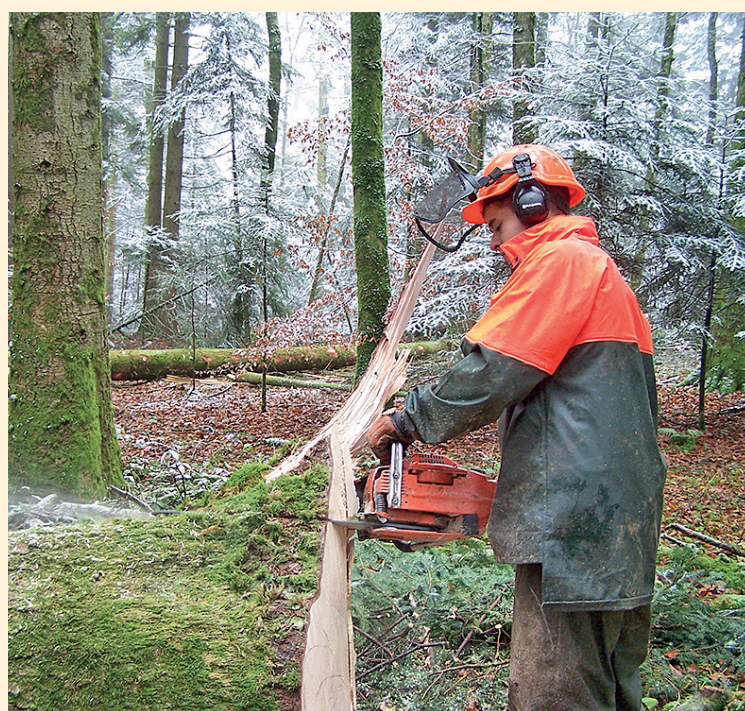
■ Un bûcheron sur cinq fait face à un accident du travail © MSAFC.