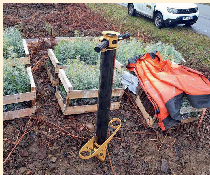
■ La canne à planter, pour réduire la pénibilité © MSAFC.