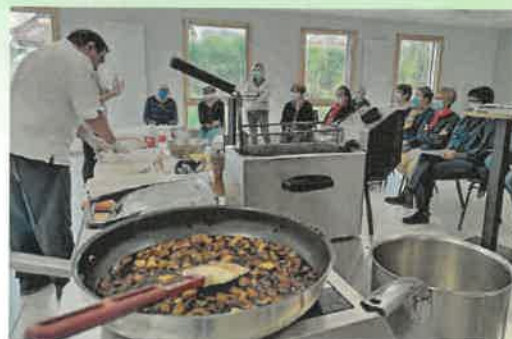
■ Bien manger sans gaspiller, ça s'apprend !

Les ateliers proposés ont apporté des enseignements d'un point de vue dié-