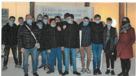
■ Les jeunes en première année de CAP de la MFR de Combeaufontaine ont suivi les débats et ont présenté leurs vidéos.