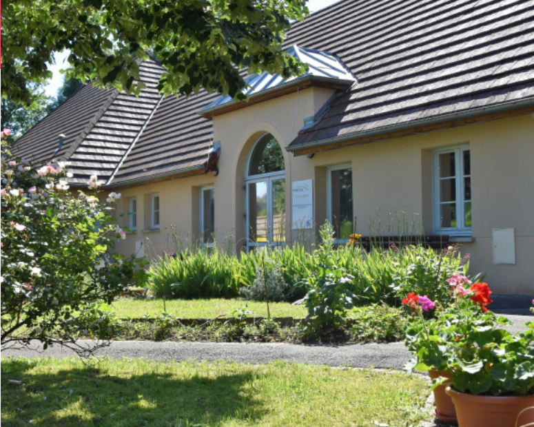
Marpa « La Fontaine des Douis » à Marnay