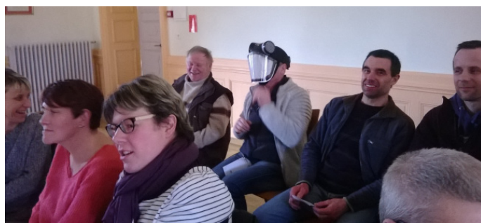
Essai de masques efficaces même s'ils font ressembler à un «robot» et suscitent les rires !