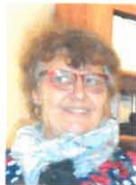
Marie - Antoinette