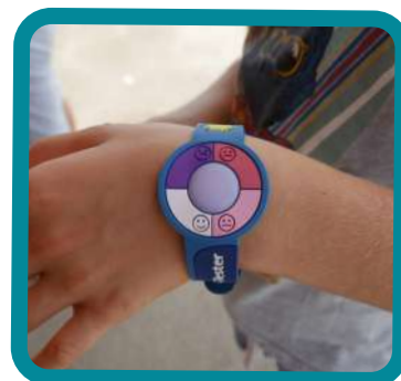
Bracelet changeant de couleur en fonction de l'intensité des UV

Plus de 80 élèves du collège Gaston Ramon en classe de 5ème ont bien apprécié les ateliers conduits par les animateurs de l'ASEPT. Chacun a pu échanger par jeux de questions-réponses sur ses représentations autour du soleil, les effets des rayons UV. Les collégiens ont été informés sur les dangers de l'exposition solaire et en particulier le bronzage passif. Deux stands d'information étaient installés à Cap Futur. Un jeune papa venant rechercher son bébé à la crèche a découvert la protection efficace des T-shirts anti UV. Plusieurs infirmières du centre de soins expliquaient aux visiteurs comment les rayons du soleil agissent sur la peau et l'importance de se protéger pour préserver sa santé.